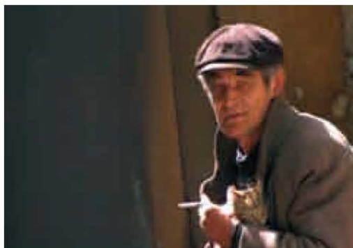
Svet po Jonu B.

Majka, ne maćeha, skrivila je i za gorak, prestupničko-kaznjenički život svog starijeg sina Silviua, glavnog junaka rumunskog igranog filma „Ako mi se zviždi, zviždim“, reditelja Florijana Šerbana. Kao Kleris Prešes Džouns, i Silviu zna da mu je mati opaka i da nenaplativo duguje za njegovu sudbinu, krojivši je dok je on bio bespomoćan. Sada, to je momenat