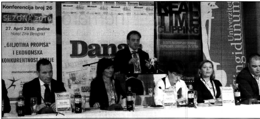
Uprkos dobroj volji Vlade rezultati izostaju: Učesnici Danasove konferencije

- Ukupna ušteda države na godišnjem nivou, ukoliko bi se